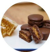
MINI PÃO DE MEL