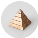
PIRÂMIDE DE GIANDUÍIA

PIRÂMIDE DE CHOCOLATE BELGA AO LEITE RECHEADA DE GIANDUÍIA (MISTURA DE CREME DE AVELÃ COM CHOCOLATE)