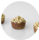
CROCANTE DE NUTELLA

CASQUINHA DE CHOCOLATE BELGA AO LEITE RECHEADO DE CROCANTE DE NUTELLA