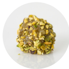
CROCANTE DE PISTACHE

BRIGADEIRO DE PISTACHE COBERTO COM UMA FINA CAMADA DE CARAMELO E FINALIZADO COM PEDACINHOS DE PISTACHE