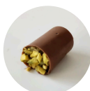
ROLINHO DE PISTACHE

CASQUINHA DE CHOCOLATE BELGA AO LEITE COM BRIGADEIRO DE PISTACHE E PISTACHE LAMINADO