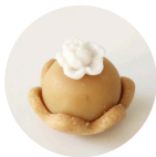
FLOR DE DOCE DE LEITE

CESTINHA DE BOLACHA AMATEIGADA COM BRIGADEIRO DE DOCE DE LEITE