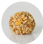
CROCANTE DE NOZES

BRIGADEIRO DE NOZES COBERTO COM UMA FINA CAMADA DE CARAMELO E FINALIZADO COM PEDACINHOS DE NOZES