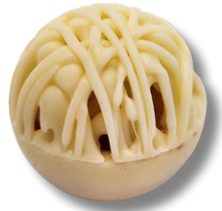
RENDADA BRANCA COM FRUTAS VERMELHAS

CASQUINHA RENDADA DE CHOCOLATE BRANCO RECHEADO DE BRIGADEIRO BRANCO E GELÉIA DE FRUTAS VERMELHAS