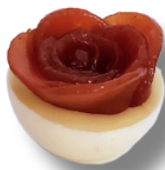
ROMEU E JULIETA

CASQUINHA DE CHOCOLATE BRANCO RECHEADO DE CREME DE CREAM CHEESE FINALIZADO COM UMA ROSA DE GOIABADA