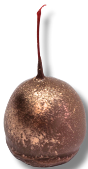
CEREJA TRUFADA AMARENA

CEREJA COBERTA COM GANACHE DE AMARENA COBERTA COM UMA FINA CAMADA DE CHOCOLATE BELGA AO LEITE