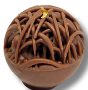
RENDADA AO LEITE COM OVOMALTINE

CASQUINHA DE CHOCOLATE BELGA AO LEITE RECHEADO DE CROCANTE DE OVOMALTINE E BRIGADEIRO BRANCO