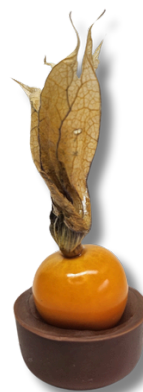
COPINHO DE PHYSALIS

COPINHO DE CHOCOLATE BELGA AO LEITE, RECHEADO DE GANACHE DE CHOCOLATE FINALIZADO COM UM PHYSALIS