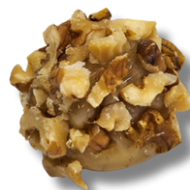
CROCANTE DE NOZES

BRIGADEIRO DE NOZES COBERTO COM UMA FINA CAMADA DE CARAMELO E FINALIZADO COM PEDACINHOS DE NOZES