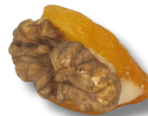
DAMASCO COM NOZES

DAMASCO RECHEADO DE BRIGADEIRO BRANCO FINALIZADO COM UMA NOZ