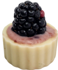
CAIXINHA DE AMORA

CASQUINHA DE CHOCOLATE BRANCO RECHEADO DE GANACHE DE FRUTAS VERMELHAS FINALIZADO COM UMA AMORA