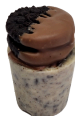
COPINHO DE OREO

CASQUINHA DE CHOCOLATE BRANCO COM PEDACINHOS DE BOLACHA OREO RECHEADO DE BRIGADEIRO BRANCO FINALIZADO COM UMA MINI OREO COM CHOCOLATE BELGA AO LEITE