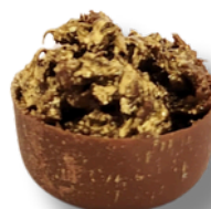
CROCANTE DE NUTELLA

CASQUINHA DE CHOCOLATE BELGA AO LEITE RECHEADO DE CROCANTE DE NUTELLA