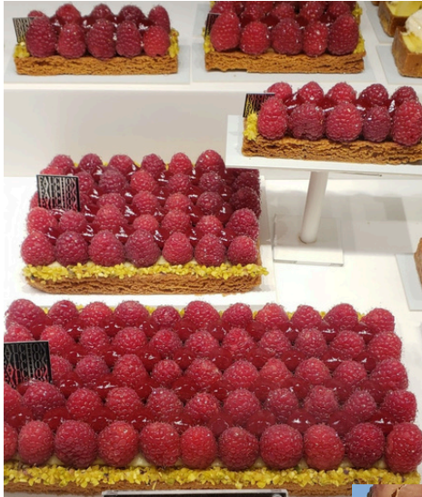
TARTE FRAMBOISE IND SABLE DE TOIN, CREME VANILLE DE MADAGASCAR, FRAMBOISES, GLAS DE PASTISQUE 7 € TARTE FRAMBOISE 4 CTS