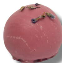
BOMBOM DE LAVANDA

GANACHE DE LIMÃO COM SEMENTE DE LAVANDA COBERTO COM UMA FINA CAMADA DE CHOCOLATE BELGA RUBY