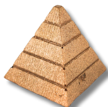
PIRÂMIDE DE GIANDUIA

PIRÂMIDE DE CHOCOLATE BELGA AO LEITE RECHEADA DE GIANDUIA (MISTURA DE CREME DE AVELÃ COM CHOCOLATE)