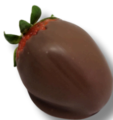
BOMBOM DE MORANGO

MORANGO COBERTO COM BRIGADEIRO BRANCO, FINALIZADO COM UMA FINA CAMADA DE CHOCOLATE BELGA AO LEITE