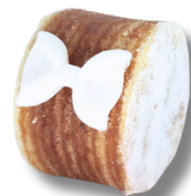
BOLO DE ROLO

RECEITA TRADICIONAL PERNAMBUCANA, INTERCALANDO FINAS CAMADAS DE MASSA E GOIABADA