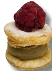
MIL FOLHAS DE FRAMBOESA

MASSA FOLHADA RECHEADA DE BRIGADEIRO DE PISTACHE, FINALIZADO COM UMA FRAMBOESA