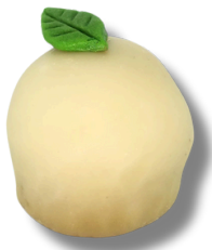
BOMBOM DE UVA

UVA ENROLADA NO BRIGADEIRO BRANCO, COBERTA COM UMA FINA CASQUINHA DE CHOCOLATE BRANCO