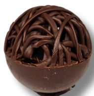
RENDADO MEIO AMARGO

CASQUINHA DE CHOCOLATE BELGA 54,5%, RECHEADO DE BRIGADEIRO MEIO AMARGO