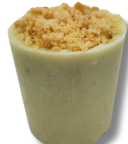
COPINHO DE LIMÃO SCICILIANO COM FAROFA

COPINHO DE CHOCOLATE BRANCO RECHEADO DE BRIGADEIRO DE LIMÃO SCICILIANO E FINALIZADO COM FAROFA